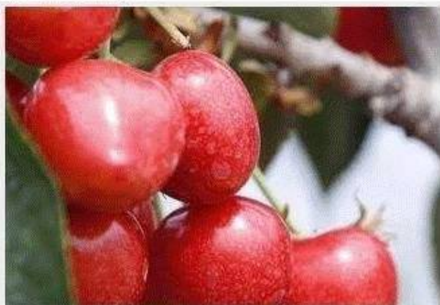
膨果着色/防畸防裂果