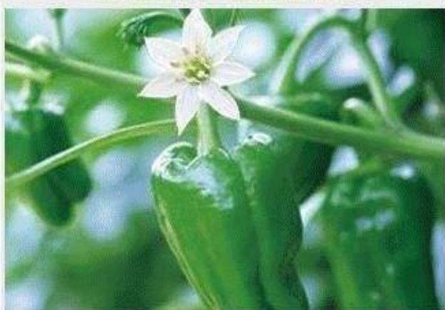
增花座果、膨大拉直、预防