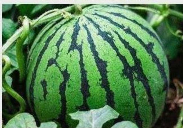
壮秧美果、膨果增甜