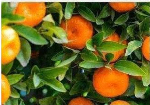
生根壮棵 保花保果