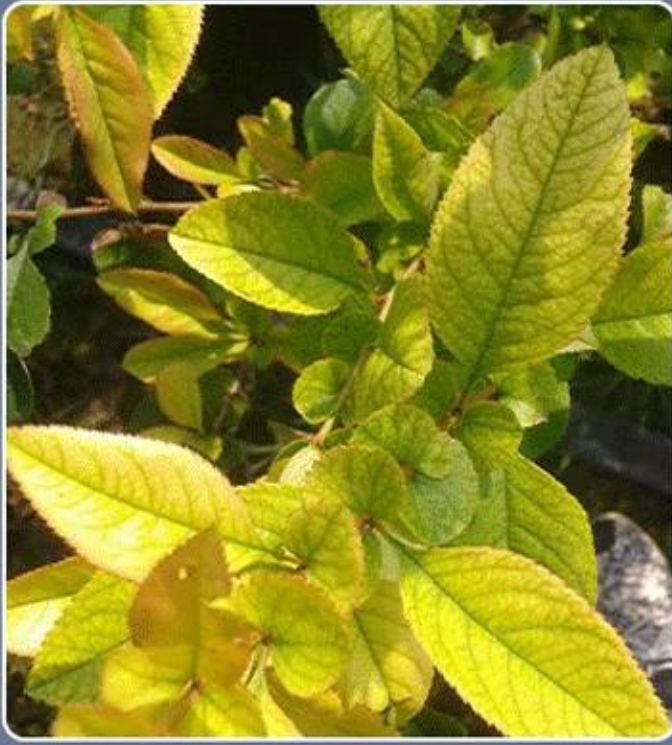
光合作用不足 抗寒能力较差