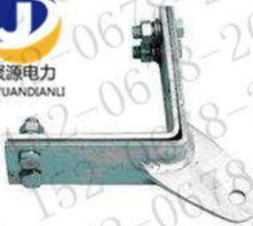
转角塔用紧固夹具