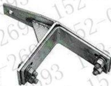
直线塔用紧固夹具