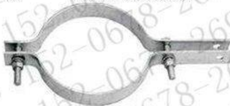
抱箍 (杆用紧固夹具)