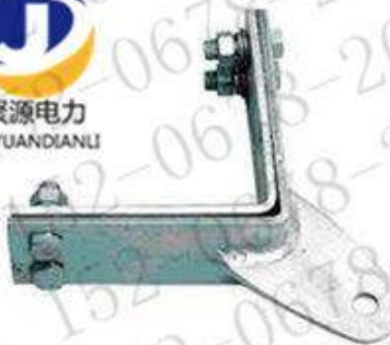
转角塔用紧固夹具