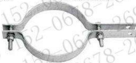
抱箍 (杆用紧固夹具)