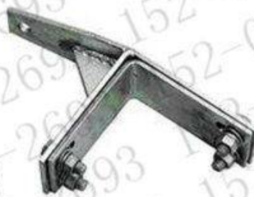
直线塔用紧固夹具