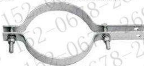
抱箍 (杆用紧固夹具)