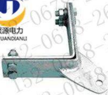
转角塔用紧固夹具