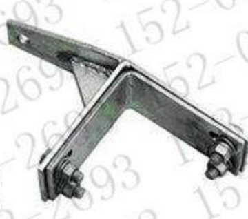
直线塔用紧固夹具