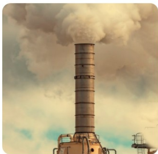
— 烟囱管道 —