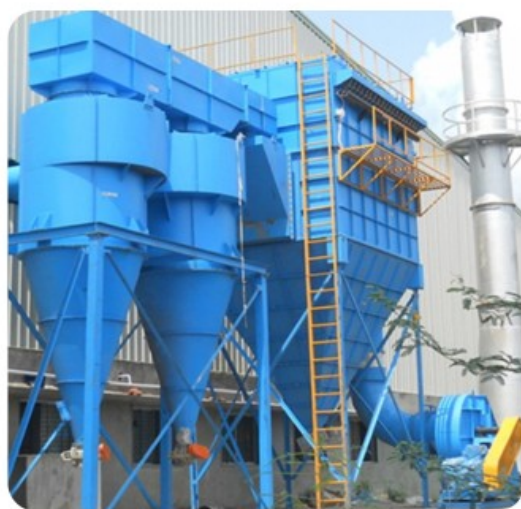
— 除尘器 —