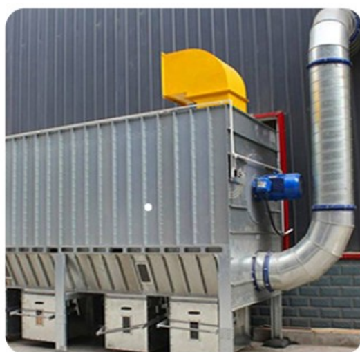
— 布袋除尘器 —