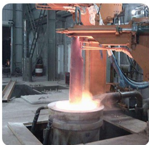
— 矿冶钢铁 —