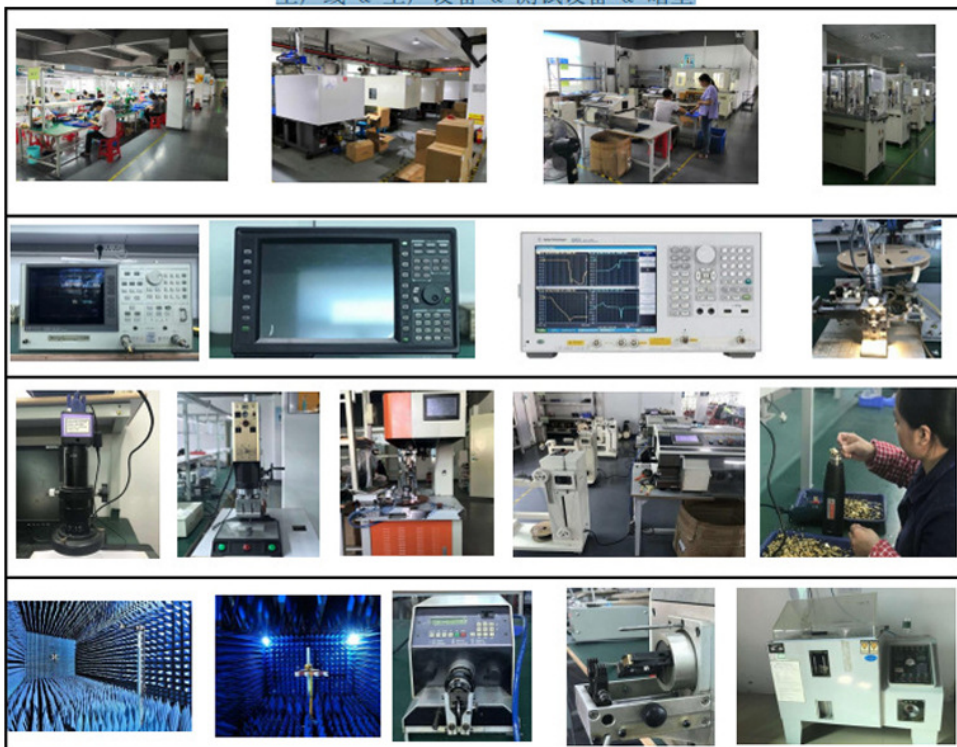
生产线 & 生产设备 & 测试设备 & 暗室