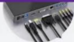
扩展坞、路由器 Docking Station, Router