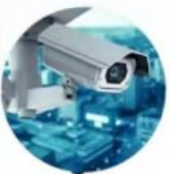
安防监控 Security Monitoring