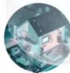
智能家居 Smart Home