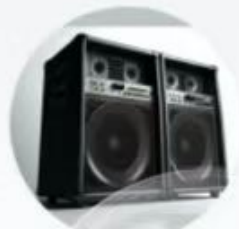
蓝牙音响、家庭音响 Bluetooth Audio, Home Audio