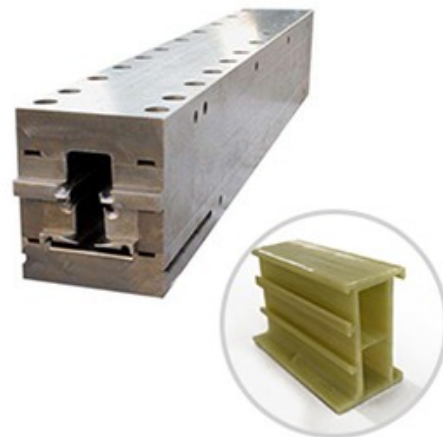
▶ 聚氨酯拉挤模具 >>