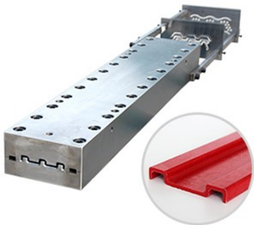
▶ 不饱和/乙烯基拉挤模具 >>