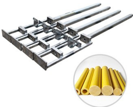
▶ 整体圆拉挤模具 >>