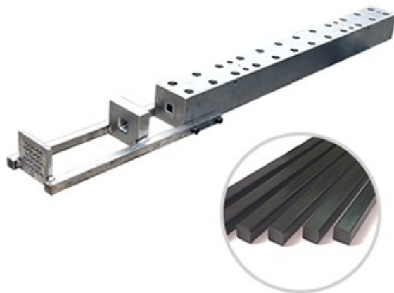
▶ 环氧/碳纤维拉挤模具 >>